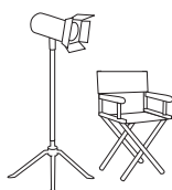
Film & TV